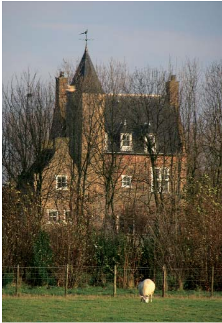
Het Hoge Huis gezien vanaf de Oudelandseweg

en vernieuwd en kreeg het gebouw zijn huidige vorm.