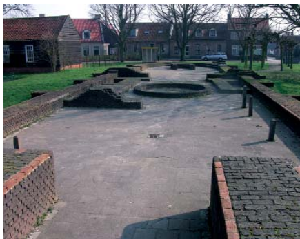
De opgemetselde fundamenten van de in 1806 afgebroken kerk

We komen nu op de Ring van Oud-Sabbinge. Oud-Sabbinge hoort tot de Zeeuwse Ringdorpen.