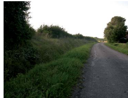
De steile randen van de Bouwensputseweg

bied gekenmerkt door hooggelegen akkerranden. Als gevolg van de ruilverkaveling zijn die voor een deel afgevlakt, al is het verschil hier en daar nog wel zichtbaar. We rijden de dijk op en zien het Veerse Meer en de beide jachthavens. Op de