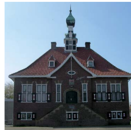
Voormalig raadhuis, nu De Griffioen

Op het eind van de Noorddijk slaan we rechts de