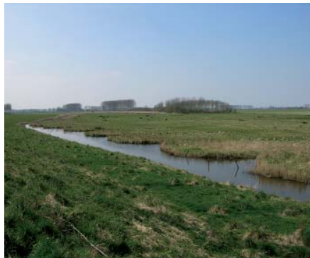
(Kreekrestant) onder aan de Oude Zeedijk

De schorren Hongersdijk, Groenje en de Mosselbank werden in 1809 door een groep Rotterdamse speculanten ingedijkt en het gebied kreeg de naam De Wilhelminapolder. In dit ge-