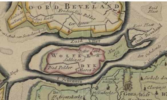
Het eiland Wolphaartsdijk, detail uit de kaart van Isaak Tirion ca. 1750

We volgen op deze tochten in grote lijnen de sporen van De Schenge, de restanten van het water dat tot in de 19e eeuw het eiland Wolphaartsdijk scheidde van het eiland Zuid-Beveland. Het vertrekpunt van de tocht is de Grote Markt in