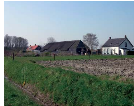
Boerderij aan het Nazareth

bied gekenmerkt door hooggelegen akkerranden. Als gevolg van de ruilverkaveling zijn die voor een deel afgevlakt, al is het verschil hier en daar nog wel zichtbaar. We rijden de dijk op en zien het Veerse Meer en de beide jachthavens. Op de