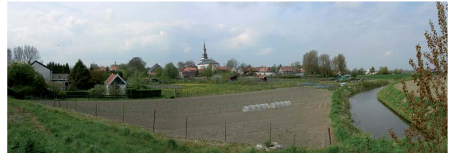
Gezicht vanaf de Noorddijk

Aan het eind van de weg gaan we de Kaaidijk en Kwistenburg op. We rijden nu langs de rand van het voormalige eiland Wolphaartsdijk en passe-