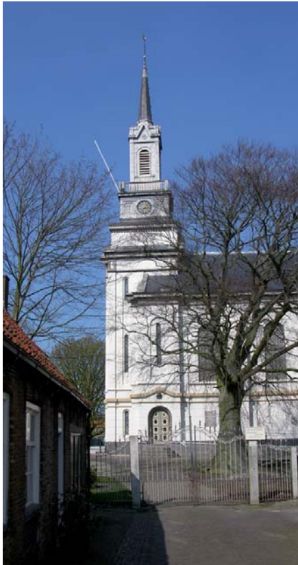
De Nicolauskerk aan de Hoofdstraat

kerk die wegens zijn slechte staat werd afgebroken.