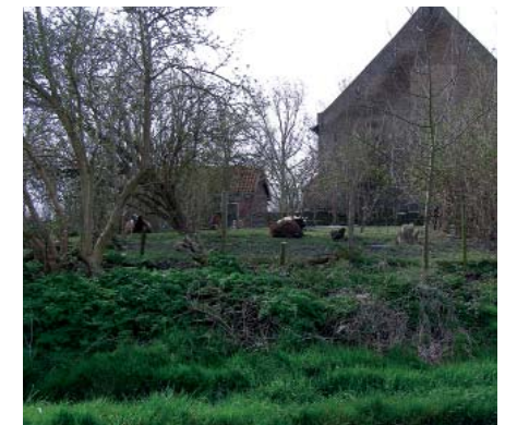
Op een hoogte boerderij Ravenstein

We gaan links de Oudelandseweg op. Rechts het 'Hoge Huis'. Het moet het geslacht Van Sabbinge ofwel Van Schenge zijn geweest die hier rond 1300 een stenen kasteel binnen een gracht liet bouwen. In 1590 vinden we in een overloper een vermelding van het Hoge Huis. Welke vorm het huis toen had is niet bekend. De geschiedschrijver J. van der Baan zag rond 1850 dat het Hoge huis niet meer dan een boerderij, een gebouw van hoge ouderdom was. In de 20e eeuw was de boerderij dermate vervallen dat sloop dreigde. In 1964 werd het Hoge Huis ingrijpend verbouwd