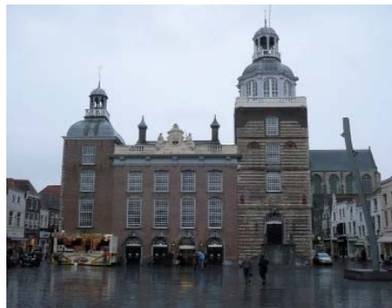
Stadhuis en Grote Kerk gezien vanaf de Oprit

Aan uw linkerzijde ziet u de Turfkade met het Gotische Huis, ook wel het Karel V huis genoemd. Het huis heeft een fraaie trapgevel, het is ge-